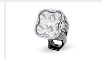
DIFFUSER LENS COVERS