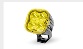
AMBER LENS COVERS